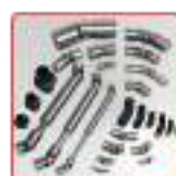
Joints de cardans et soufflet