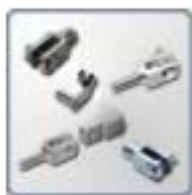
Chapes de tringlerie