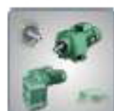
Motoréducteur compabloc manubloc