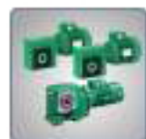
Motoréducteur multibloc orthobloc