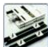
Glissières pour moteurs