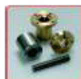
Arbres cannelés, moyeux cannelés et anneaux de serrage