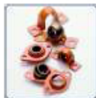
Paliers tôle avec coussinets autolubrifiants