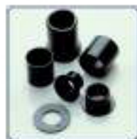
Coussinets lisses autolubrifiants en polymères