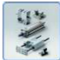
Vérins et accessoires