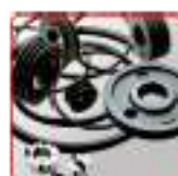
Poulies et Courroies trapézoïdales