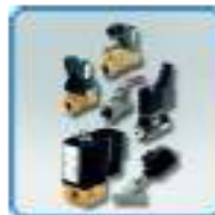
Electrovannes et vannes