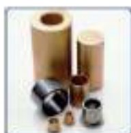
Coussinets autolubrifiants bronze et alliage ferreux