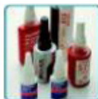
Collage, fixation, freinage et étanchéité chimique