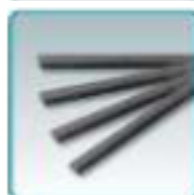
Barreaux à clavette