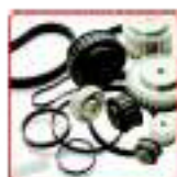
Poulies et Courroies dentées