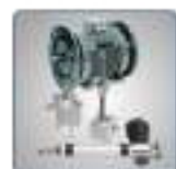
Vérins mécaniques et électriques, embrayage et frein