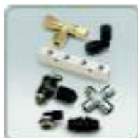
Raccords et accessoires