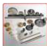
Engrenages, crémaillères et couples coniques