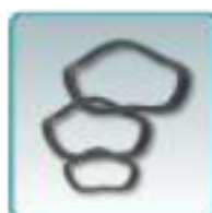
Rondelles élastiques pour roulements à billes