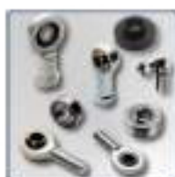
Rotules et Embouts à rotule