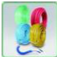
Tuyaux, tubes et gaines