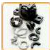
Paliers fonte à semelle et composants

■ La gamme DIRECT TRANSMISSION sur www.michaud-chailly.fr