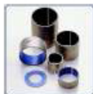
Coussinets lisses métalliques