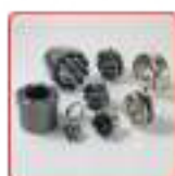
Manchons et moyeux expansibles, frettes de serrage