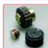
Limiteurs de couple