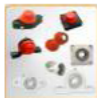
Paliers auto-aligneurs anti-corrosion