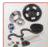
Chaînes, pignons et accessoires