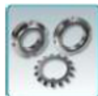
Ecrus et rondelles freins