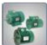
Moteur asynchrones triphasés