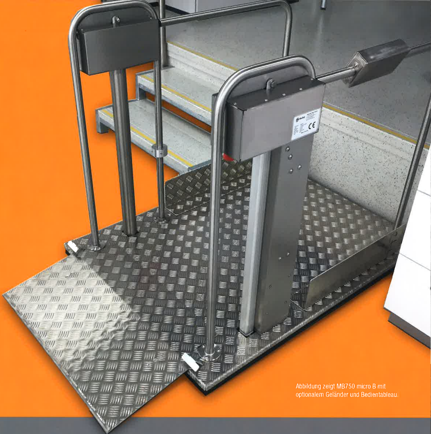
Abbildung zeigt MB750 micro B mit optionalem Geländer und Bedientableau.