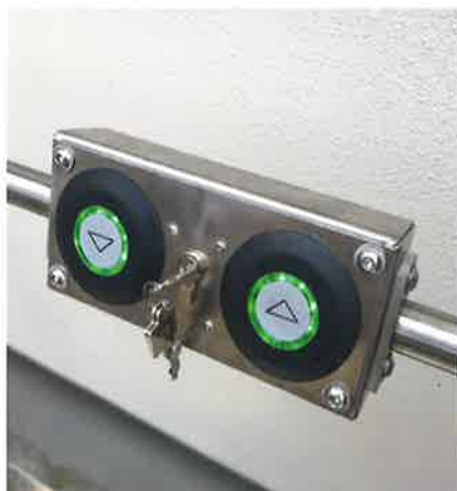
Optional auch mit Smartphone-App über Bluetooth bedienbar.