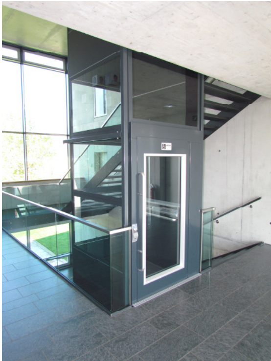
Nachträglicher Einbau im Treppenhaus eines Schulhauses