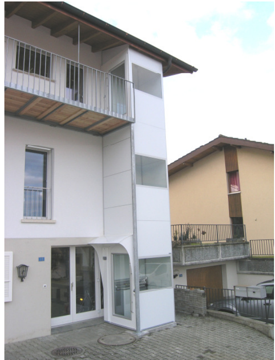
Zugang zu oberer Wohnung über den Balkon