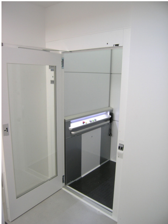
Lifteinbau in bauseitigen, gemauerten Schacht in Mehrfamilienhaus