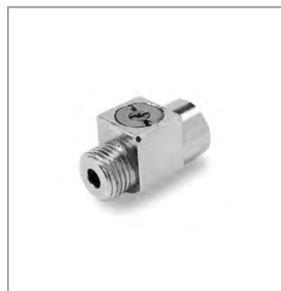
Regolatore micrometrico a vite