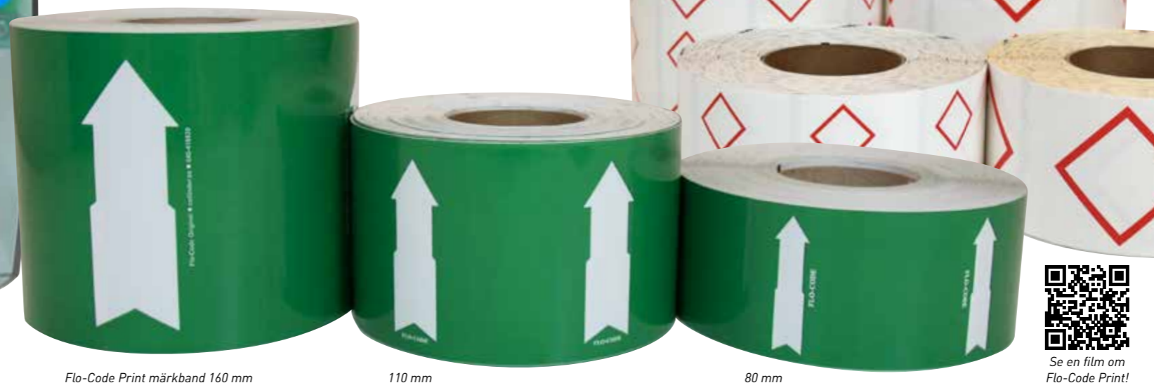
Flo-Code Print märkband 160 mm

Märkband med tomma röda GHS-ramar för tryck av GHS faropiktogram vid märkning av farliga ämnen.