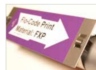
Flo-Code på dekalhållare för heta rör. Här fäst med spännband och fästskub som ger distans till röret.