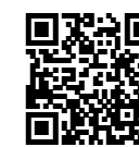
Se en film om Flo-Code Print!