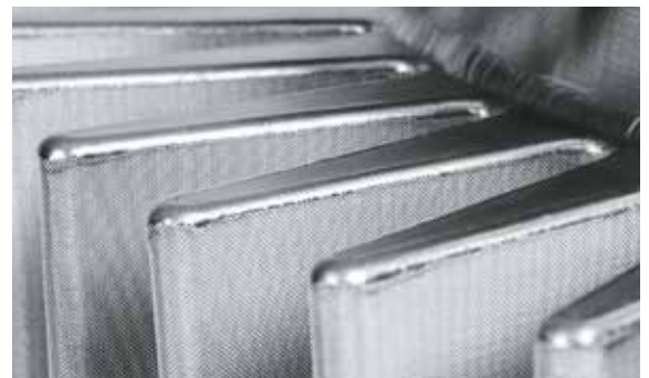
Perfekte Schweissnähte, maximale Langlebigkeit