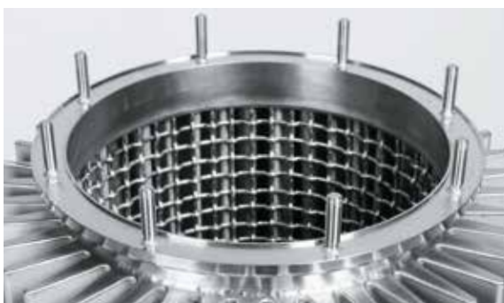
Präzise Integration der Anbauteile