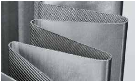
Exakte Formgebung für jede Einbausituation