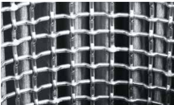
Stabiles Stützgitter für hohe Durchflussleistung