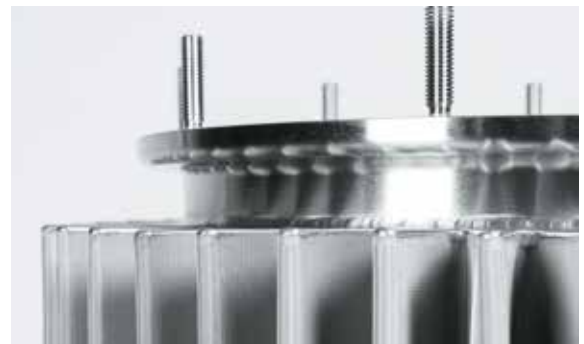
Kreative Lösungen für hohe Ansprüche