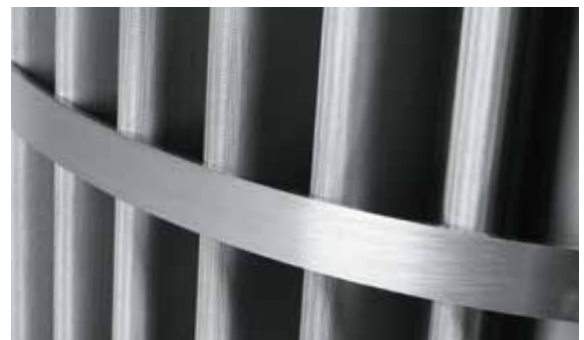
Konstruktive Sicherheitsmerkmale für störungsfreien Betrieb