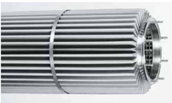
Einzelfertigung bis Serienproduktion