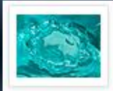
Water Meter Cabinets