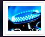
Natural Gas Cabinets