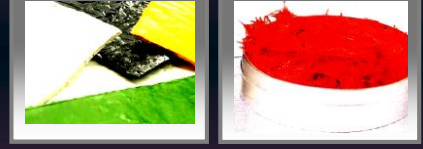
SMC & BMC Compound