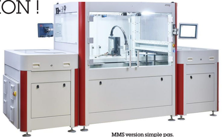
MMS version simple pas.

"Nous avons fait régulièrement évoluer ce concept. En 2003, nous avons lancé le système numérisé d'assemblage A3D, qui proposait une gamme plus étendue de formats de palettes, avec des charges embarquées plus importantes et des vitesses de convoyage supérieures, permettant de réduire le temps d'échange de palette à palette", explique Patrice Caudron, directeur commercial. Cette même année 2003, PRODEL intégrait le groupe international IPTE, qui compte aujourd'hui plus de 800 collaborateurs répartis sur 12 sites dans le monde. Cette présence internationale permet d'accompagner ses clients dans leur développement mondial.