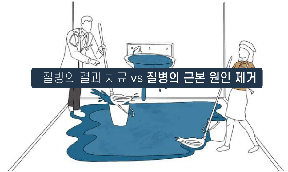
▲ 물이 새는 근본 원인을 찾지 못해 계속해서 바닥만 닦고 있는 의사와 간호사의 모습

생활습관을 형성하는 것은 병원을 찾는 일만큼이나 쉽게 느껴지지 않고 건강한 생활습관의 중요성은 영리적인 목적에 의해 종종 가려지곤 합니다