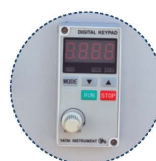
Velocidad variable Variable speed Vitesse variable