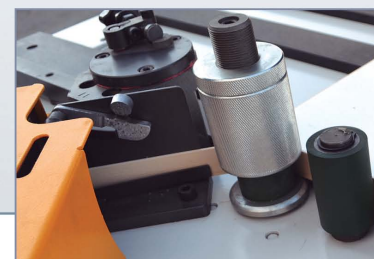
Calderín de cola Glue tank Bac à colle