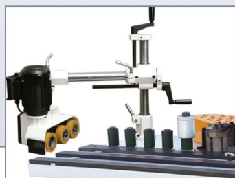
Opcional alimentador Optional feeder Optionel entraineur à rouleaux