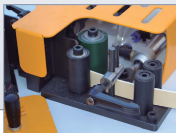
Alimentación de canto automático Automatic edge feeding Automatique entrainement du chant