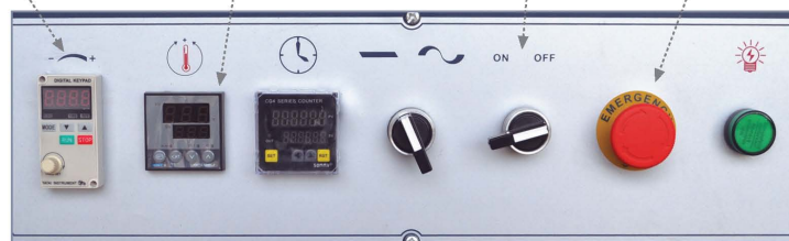
Panel de control Control panel Tableau de contrôle