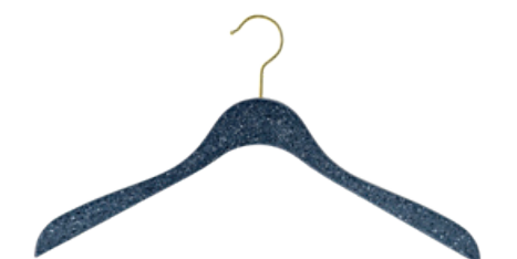
aus Textilien und textilen Abfällen