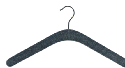
Re- und upcyclt