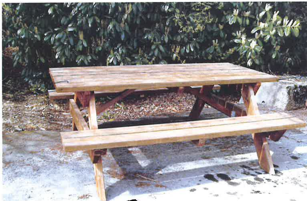
TABLE AIRE DE REPOS TRAITÉE EN KIT