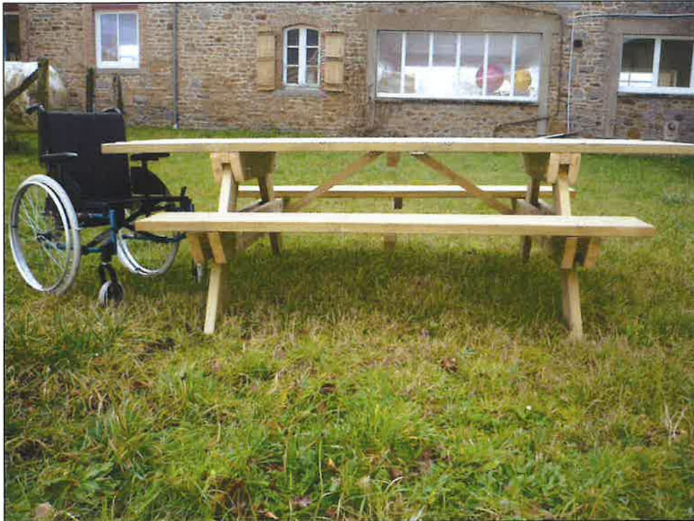
TABLE AIRE DE REPOS TRAITÉE HANDICAP