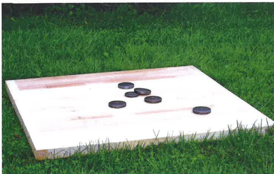
PLANCHE A PALETS