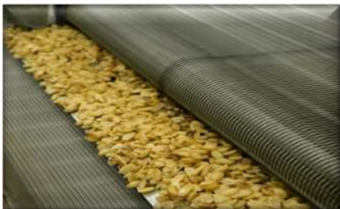
Traitement de fruits secs & épices