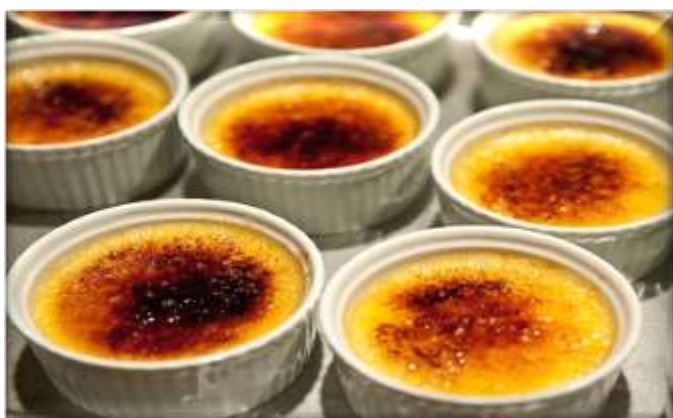
Crème lactée, Meringue