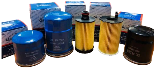
CARSTATION Oil Filters