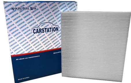
CARSTATION Cabin Filters