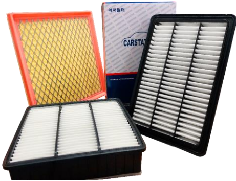
CARSTATION Air Filters