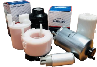
CARSTATION Fuel Filters