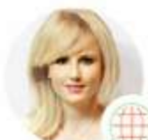
Déborah.H Desarrollo web Atención al cliente