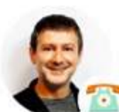
Ange.T Atención al cliente Francia