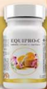
1 Equipo C 60 cápsulas