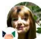
Florence.D Intervención ferias