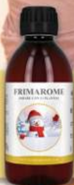
1 Frimarome 250 ml