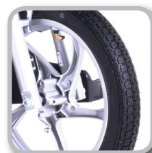
Grosse 14" Räder