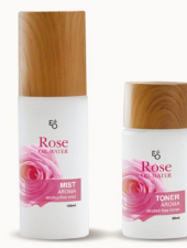
ROSE MIST & TONER 이오워터 로즈 미스트 & 토너

카렌둘라오일 효능 아토피 피부에 탁월, 항염력, 항균력, 재생능력 향상.