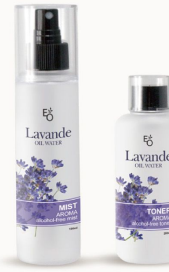
LAVANDE MIST & TONER 이오워터 라반드 미스트 & 토너