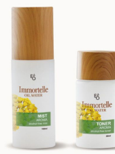
IMMORTELE MIST & TONER 이오워터 임모르텔 미스트 & 토너