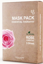
ROSE MASK - 로즈 마스크