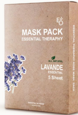
LAVANDE MASK - 라반드 마스크