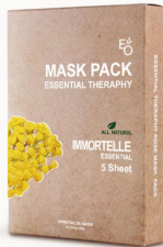
IMMORTELE MASK - 임모르텔 마스크