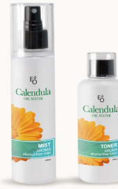
CALENDULA MIST & TONER 이오워터 카렌둘라 미스트 & 토너