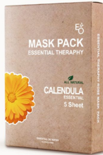
CALENDULA MASK - 카렌둘라 마스크