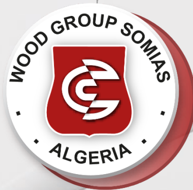
WOOD GROUP SOMIAS 45%

Le Groupe ASMIDAL compte dans son portefeuille quatre (04) participations :