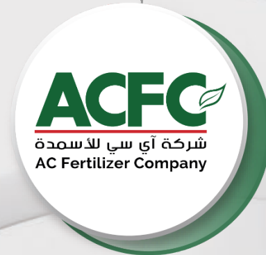
Algerian Chinese Fertilizers Company 37%