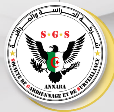
Société de Gardiennage et de Surveillance 20%