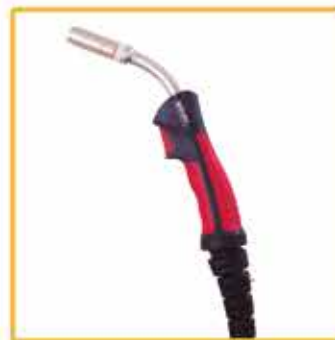
Antorcha 25 4 metros Ref. 880025P