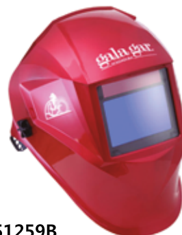
51259B Careta tig Galaxy