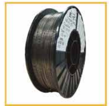
Bobina 5 kg hilo tubular SIN GAS Ref. B10971T115