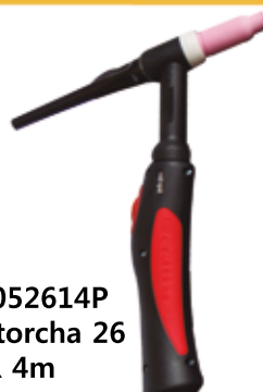
19052614P Antorcha 26 SR 4m