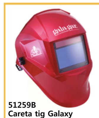
51259B Careta tig Galaxy