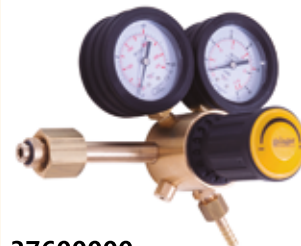
37600000 Regulador argon CO2